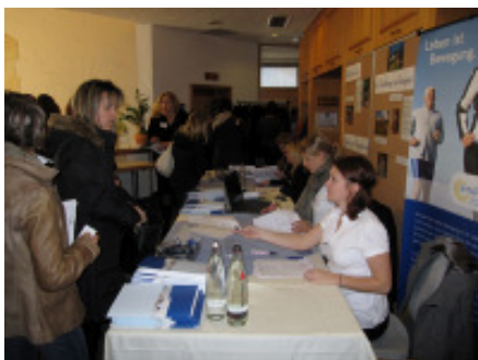
Team des meditrust-Kongressbüros mit Gästen bei der Registrierung