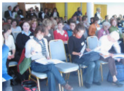
Die Auswertung der Evaluierungsbögen ergab ein äußerst positives Feedback der geladenen Gäste