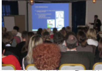
... und verfolgten die Vorträge zum Thema „Kniegelenkersatz: Stand der Technik rund um die OP“