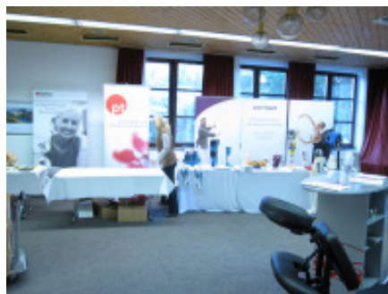
Präsentation moderner Produkte und Dienstleistungen rund um die Knie-OP in der Industrieausstellung