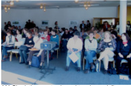
220 Physiotherapeuten besuchten den endofit-Fachkongress in Garmisch-Partenkirchen