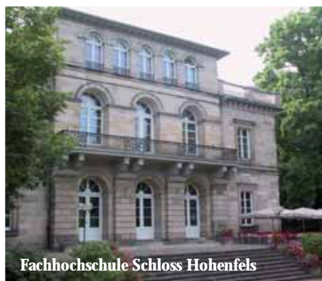
Fachhochschule Schloss Hohenfels