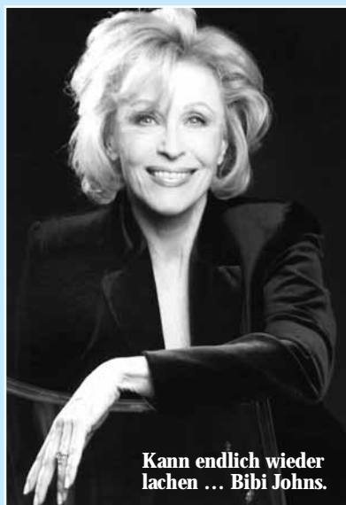
Kann endlich wieder lachen ... Bibi Johns.

„Nur das Laufen passte in den letzten Jahren immer weniger zu meinem Gesicht und meiner Figur!“