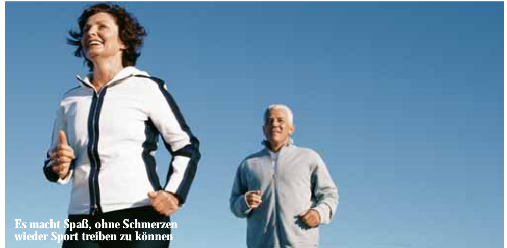
Es macht Spaß, ohne Schmerzen wieder Sport treiben zu können

Jüngstes Beispiel ist eine Gemeinschaftsentwicklung zwischen der endogap Klinik und der Firma DePuy Orthopädie. Die unter der Markenbezeichnung Duraloc® endogap entwickelte Hüftpfanne ist patentrechtlich geschützt. Sie ist Bestandteil eines künstlichen Hüftgelenks und ersetzt die durch fortgeschrittene Arthrose geschädigten Gelenkanteile im Becken. Seit Markteinführung der ersten Duraloc Pfanne im Jahr 1990 wurde sie mittlerweile nahezu 400.000 mal implantiert und damit innerhalb kürzester Zeit zur weltweit meistverwendeten zementfreien Hüftpfanne. Sie besteht hauptsächlich aus Titan, einem Material, das sich durch eine ausgezeichnete Körperverträglichkeit und Langzeitstabilität auszeichnet. „Wir haben das ursprünglich aus den USA stammende Design durch einen veränderten Kunststoffeinsatz ergänzt, um es noch sicherer zu machen,“ sagt Dr. Christian